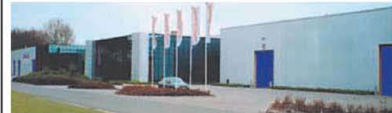
Das Unternehmen bietet höchste Qualität.

Musterwintergärten zu einem sagenhaften Preis erwarten Sie. Näheres unter Tel. 089/84930987 sowie www.isarland-wintergaerten.de . NaSe