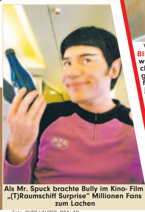
Als Mr. Spuck brachte Bully im Kino-Film „(T)Raumschiff Surprise“ Millionen Fans zum Lachen