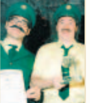
Bully Herbig (re.) und Rick Kavanian bei der Verleihung des BLM-Hörfunk-Preises