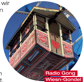
Radio Gong Wiesn-Gondel

Gemeinsam mit unserem Kunden M-net haben wir auch in diesem Jahr wieder Hörer im Rahmen einer sympathischen Promotion-Kampagne eingeladen und ihnen einen unvergesslichen Wiesn-Tag ermöglicht.