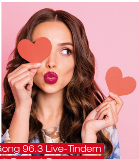
Gong 96.3 Live-Tindern mit Deckel-Donnerstag

Außerdem gibt's zum Start ins neue Jahr wieder neue Benchmarks im Programm. Beim „Deckel Donnerstag“ vermitteln wir Münchner Singles in