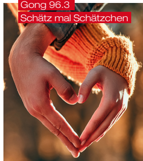
Gong 96.3 Schätz mal Schätzchen

der Mike Thiel Show und machen ein sympathisches „Live-Tindern“ im Radio. Und ebenfalls neu: „Schätz mal Schätzchen“ in der Gong 96.3 Feierabend Show. Pärchen kämpfen darum, wer die unliebsamen Aufgaben daheim erledigen muss, wie zum Beispiel Geschirr abwaschen oder Staubsaugen. Bei beiden Benchmarks haben Sie die Möglichkeit, mit Ihrem Unternehmen im Programmumfeld von Gong 96.3 als Sponsor aufzutreten. Gerne lassen wir Ihnen die Angebotsmöglichkeiten zukommen.